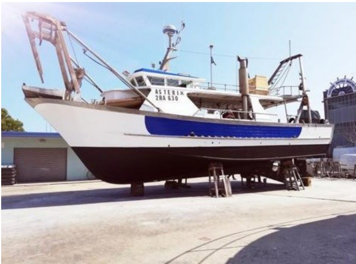
(Peschereccio Asterix 2RA630 che sarà utilizzato nelle aree di campionamento)